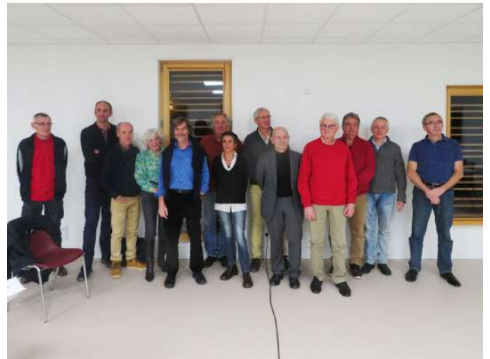
Le conseil de gestion nouvellement élu

qui a conduit à la constitution de Cevidorées : « Ce n'est qu'une première marche qui a été franchie, a-t-il rappelé, nous devons désormais nous mobiliser pour déployer notre réseau sur tout le territoire Beaujolais Pierres-Dorées, constituer notre potentiel de toitures et faire appel à de nouveaux souscripteurs afin de peser financièrement auprès des banques pour obtenir des prêts qui nous